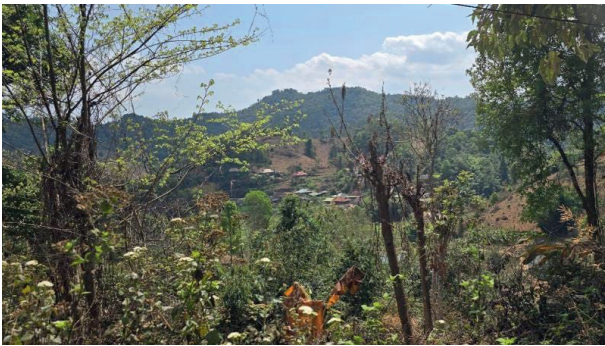
Das schwer erreichbare Điền Biên Phủ .

hielt das französische Militär Điền Biên Phủ für uneinnehmbar. Im Vertrauen auf ihre Luftüberlegenheit und ihre befestigten Stellungen wollten sie die Viet Minh in einen offenen Kampf locken und sie mit ihrer überlegenen Feuerkraft überwältigen. Diese Selbstüberschätzung sollte ihnen jedoch zum Verhängnis werden.