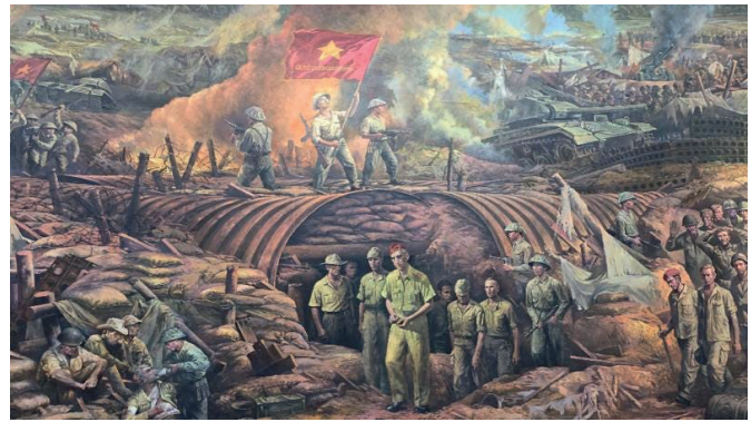
Gemälde, das die Kapitulation der Franzosen darstellt.

Er war weitgehend Autodidakt in der Kriegskunst und trat in den 1940er Jahren als beeindruckender Guerillaführer in Erscheinung. In den 1950er Jahren beherrschte er sowohl die irreguläre als auch die konventionelle Kriegsführung. Seine Strategien, die er in jahrelangen Konflikten verfeinert hat, sind nach wie vor Teil der militärischen Lehrpläne auf der ganzen Welt.