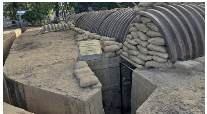
Der Bunker des französischen Kommandanten Christian de Castries in Điền Biên Phủ .