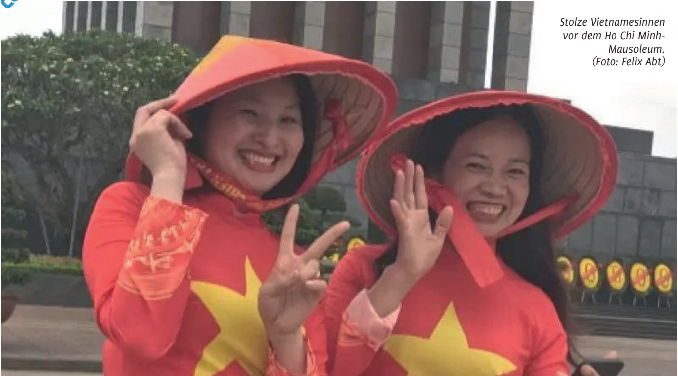
Stolze Vietnamesinnen vor dem Ho Chi Minh- Mausoleum.