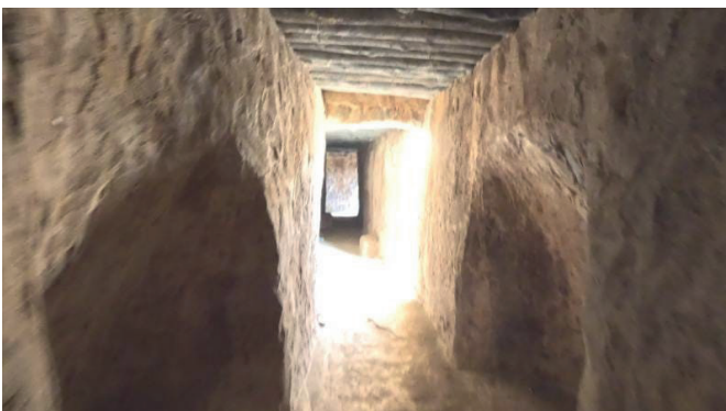
Teil eines ausgeklügelten Tunnelsystems in der Nähe der französischen Verteidigungslinien, gebaut von den Viet Minh.

Giáp war für seine intellektuelle Strenge bekannt und wurde von seinen Klassenkameraden als außergewöhnlich begabt in Erinnerung behalten. Er verschlang militärische Texte – von klassischen chinesischen Strategien und französischen Feldzügen bis hin zu vietnamesischen Kriegstraditionen.