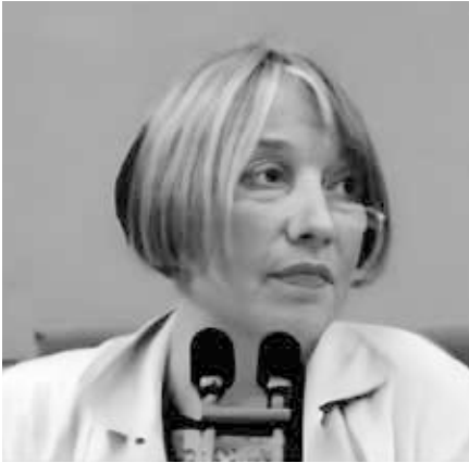
Antje Vollmer 2003