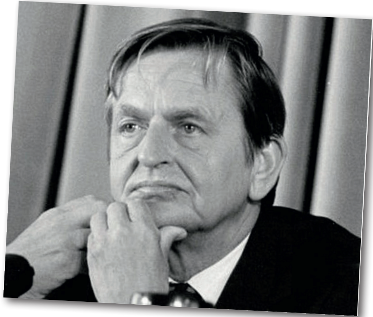
Premierminister Olof Palme 28. September 1984 (Foto: Ministry of the Presidency, Government of Spain, gemeinfrei).

Dieser Text wurde zuerst am 27.09.2025 auf www.substack.com unter der URL https://olatunander.substack.com/p/the-killing-of-pm-olof-palme-part veröffentlicht. Lizenz: © Ola Tunander