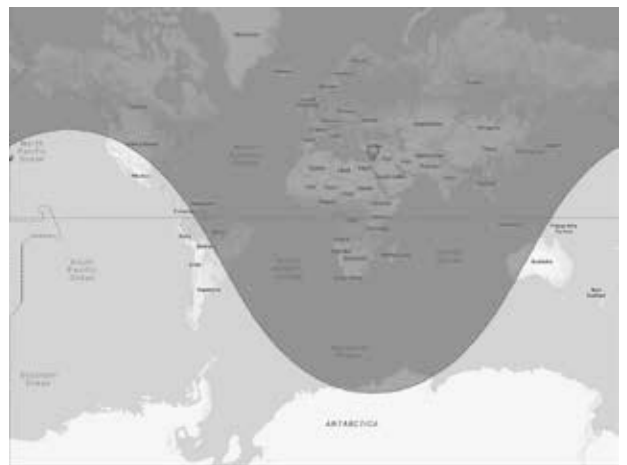
Länder, die innerhalb der Reichweite israelischer Jericho III Atomraketen liegen.

Womit sich Deutschland zur Zeit gegen die israelische und US Außenpolitik stellen müsste.